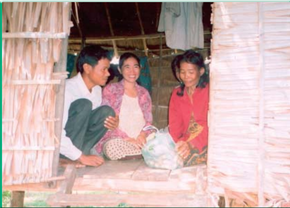
Los voluntarios de la Cruz Roja de Camboya visitan periódicamente a las familias de zonas rurales afectadas por el VIH/SIDA, y les prestan ayuda.